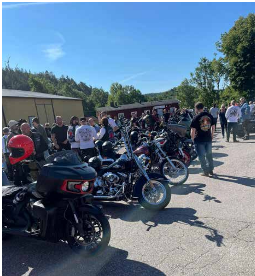
Uppställning inför start.