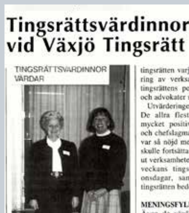
De första tingsrättsvårdinnorna uppmärksammas i Tidningen Brottsoffer nr 4 1995.